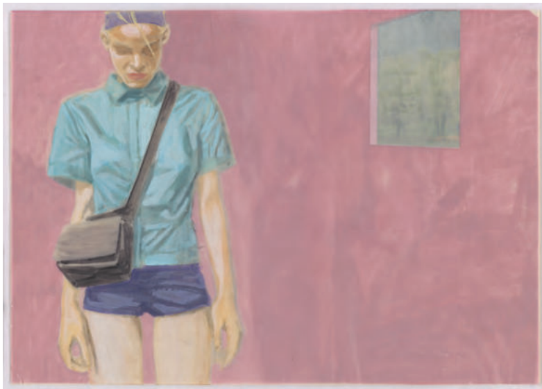
ANZEIGE Tim Eitel: Fenster, 1999; © VNG AG Leipzig