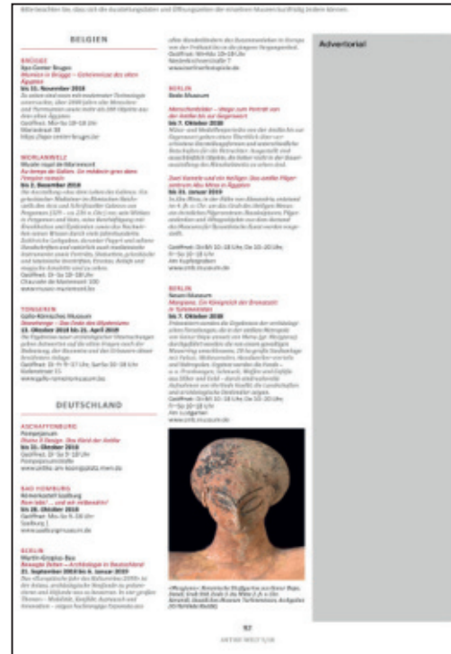
1/3 Seite hoch Satzspiegel: 57 x 252 mm Anschnitt: 67 x 297 mm*

Das Advertorial wird von der Redaktion unter Beachtung des Zeitschriftenlayouts und -Designs gesetzt. Für die Datenlieferung werden benötigt: ein bis zwei Abbildungen (mind. 300 dpi) sowie Text (1000 Z. inkl. Leerzeichen)