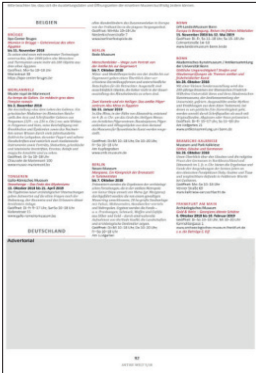
1/3 Seite quer Satzspiegel: 181 x 89 mm Anschnitt: 210 x 111 mm*

Ein besonderer Blickfang für Ihre Werbepresenz in der ANTIKE WELT. Seit 2019 haben wir die beliebte Rubrik „Ausstellungskalender“ für Advertorials des Formats 1/3 Seite quer und hoch geöffnet.